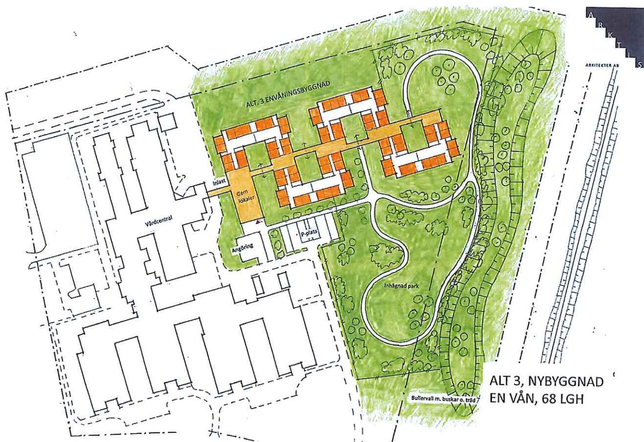
VÅRD-OCH OMSORGSBOENDE, HALLSBERG – FÖRSLAGSSKISS 2017-05-03